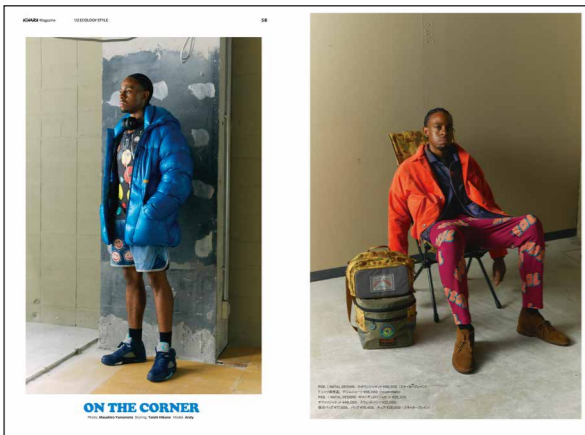
ビジュアル重視のタイアップ例