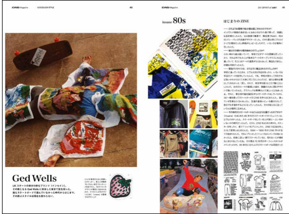
取材形式のタイアップ例