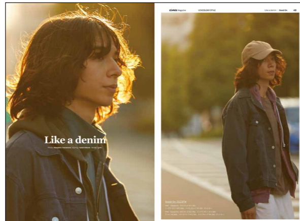
ビジュアル重視のタイアップ例