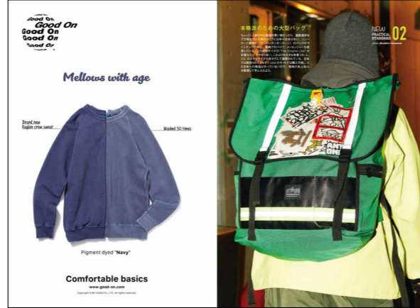
ニュース形式のタイアップ例