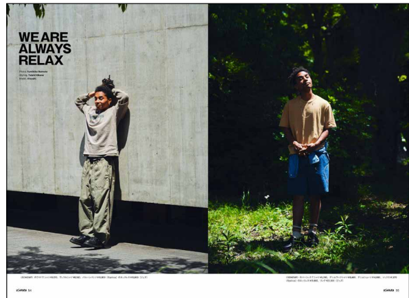
ビジュアル重視のタイアップ例