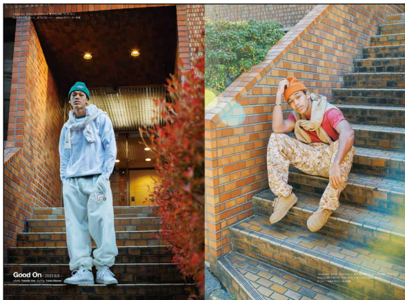
ビジュアル重視のタイアップ例