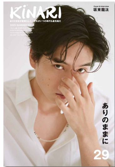
KINARI vol.29 (2025年5月発売号)

誌面では、ものづくりを続ける作り手やデザイナー、独自の感覚で選び続けてきたショップや表現者取材し、スタイル提案やアート、身体感覚にまつわるテーマまでを横断的に編集しています。ファッションを消費ではなく感覚として捉え、カルチャーを生活の延長として伝えることで、読者一人ひとりが自分の価値観や速度を肯定できる余白を残す。KINARI は、平和な近未来につながる生き方のヒントを、静かに、誠実に届け続けます。